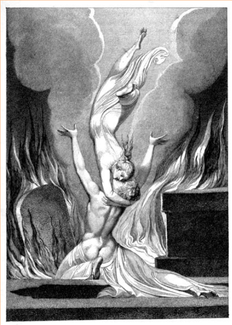
Image: The Reunion of the Soul and the Body , William Blake, 1808